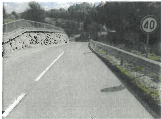
Položaj vozila, ki se vključuje in pogled proti centru Rogoške Slatine

Voznik vozila, ki se vključuje iz omenjene nekategorizirane ceste v levo na Stritarjevo ulico v smeri centra Rog. Slatine (ob upoštevanju reakcijskega časa) opazi vozilo, ki prihaja iz smeri centra Rogoške Slatine proti »obvoznici«, torej že okoli 40m pred križiščem. Omejitev hitrosti iz smeri centra Rogoške Slatine je 50 km/h. Od mesta, kjer vključujoči se voznik opazi vozeče vozilo na prednostni cesti proti križišču je rahlo v klancu navzgor (nagib ceste okoli 8%). Na