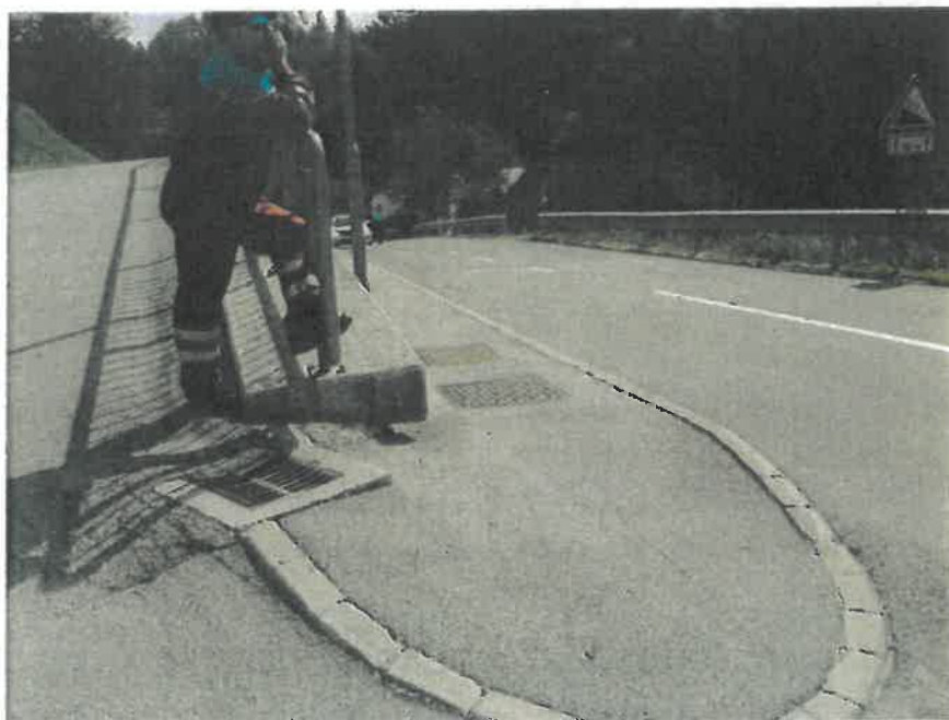
Preglednost s točke, ki je 3 metre oddaljena od roba glavne prometne smeri ob pravilnem razvrščanju, kjer je razvidna vidljivost prihajajočega vozila na razdalji 40 m

podlagi določil 18. člena Pravilnika o projektiranju cest je potrebna zaustavitvena razdalja pri omejitvi hitrosti 50 km/h, kot je ta v naselju Rog. Slatina, 40 metrov .