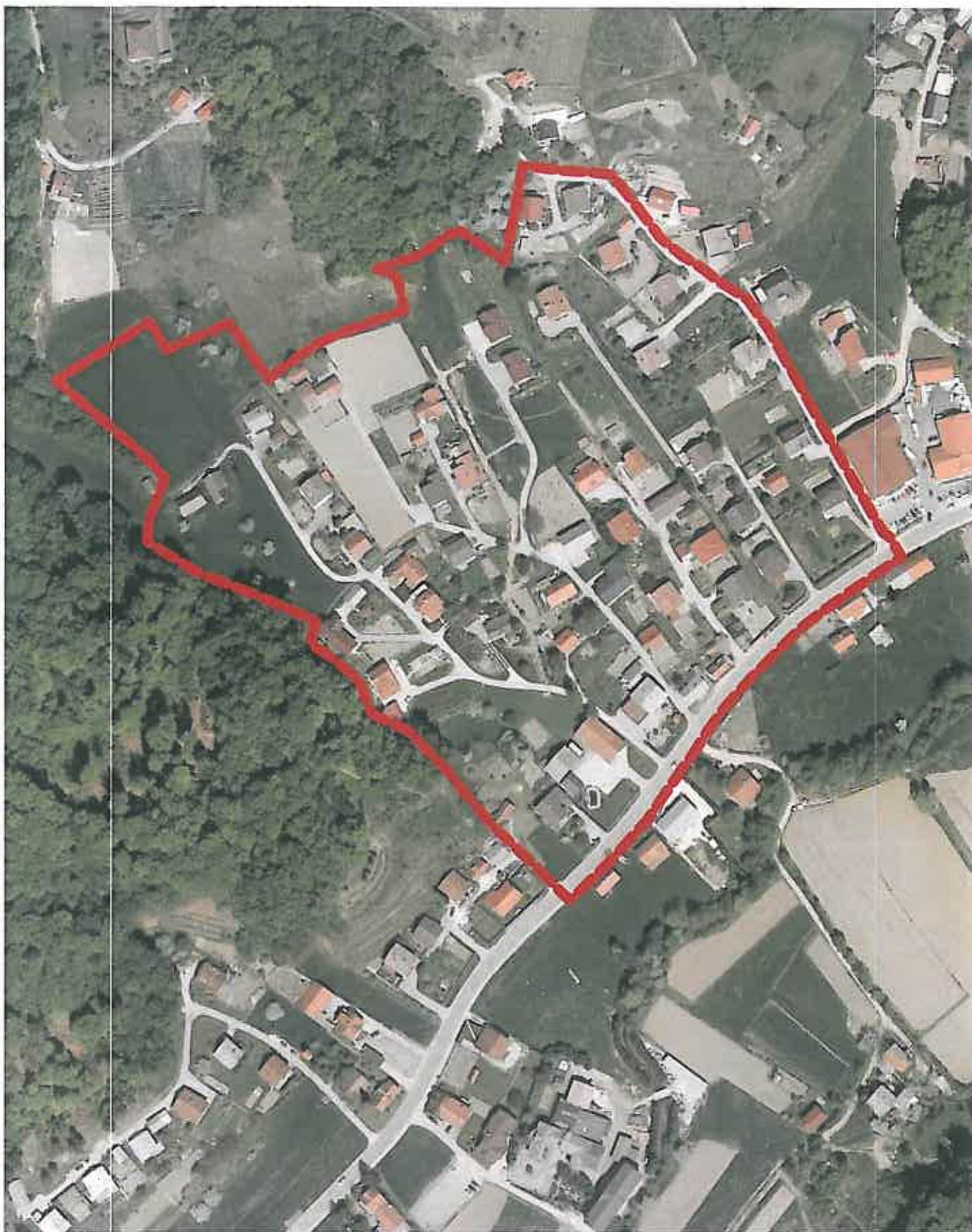
Prikaz pozidanosti območja Zazidalnega načrta S 8 a Tržišče