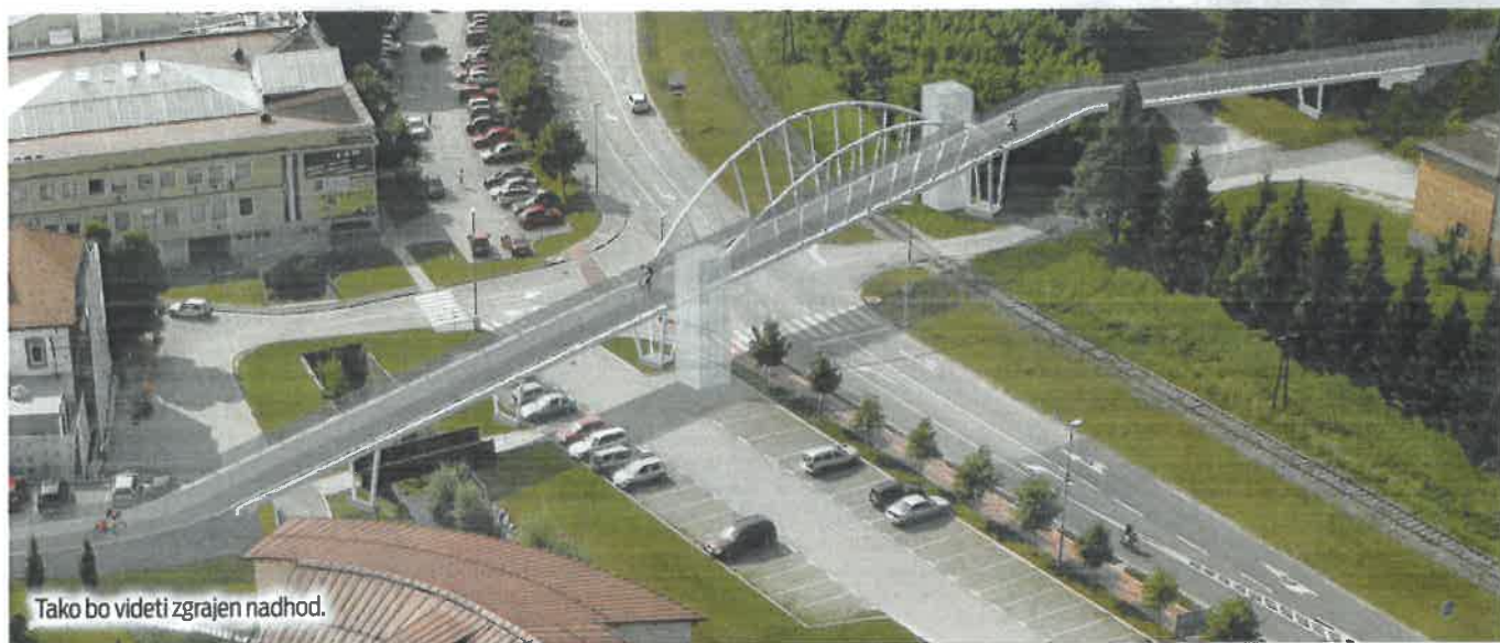
Tako bo videti zgrajen nadhod.

Eden od pomembnejših projektov za razvoj turizma v Rogaški Slatini bo izgradnja nadhoda preko glavne ceste skozi mesto, ki ga bodo zgradili s parkirišča pri Restavraciji Sonce do vznožja Tržaškega hriba. Izvedba projekta je zanimiva tudi zaradi tega, ker bo Občina Rogaška Slatina od Eko sklada pridobila skoraj vsa finančna sredstva za izvedbo projekta. V nadaljevanju objavljamo nekaj najpomembnejših dejstev o tem projektu.