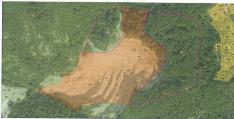
Slika 1: Obstoječe stanje (veljavni OPN) za območje Zg. Gabernik

Prostorski izvedbeni pogoji veljavnega OPN za EUP = ZGA1 dopuščajo nadaljnjo izrabo kamnoloma ob sproti sanaciji že izkoriščenih površin. Severozahodni del starega kamnoloma leži na vodovarstvenem območju, vzhodni del pa na robu krajinskega parka Boč, Plešivec. Spremembo predstavlja prostorska vključitev obeh imenovanih območij v kamnolom na način, da se spremeni podrobnejša namenska raba iz G v LN, PIPP pa na teh območjih ne predvidevajo več izkoriščanja, temveč sanacijo.