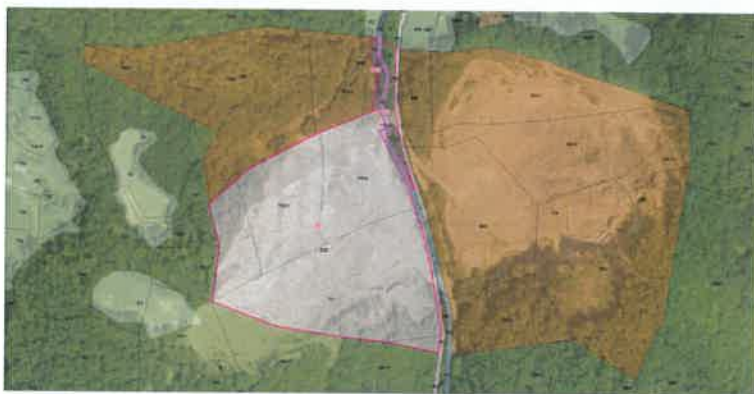
Slika 3: Obstoječe stanje (veljavni OPN) za območje Zagaj

Prostorski izvedbeni pogoji veljavnega OPN za EUP = ZPB1 predpisujejo zaprtje in sanacijo tega dela kamnoloma. Spremembo predstavlja drugačna definicija podrobnejše namenske rabe in sicer iz OO (ostala območja) v LN (površine nadzemnega pridobivalnega prostora).