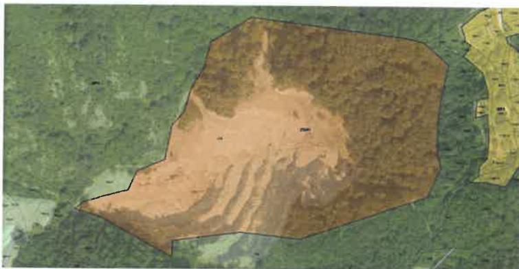
Slika 2: Predlog spremembe OPN za območje Zg. Gabernik

Prostorski izvedbeni pogoji veljavnega OPN za EUP = ZPB1 predpisujejo zaprtje in sanacijo tega dela kamnoloma. Spremembo predstavlja drugačna definicija podrobnejše namenske rabe in sicer iz OO (ostala območja) v LN (površine nadzemnega pridobivalnega prostora).