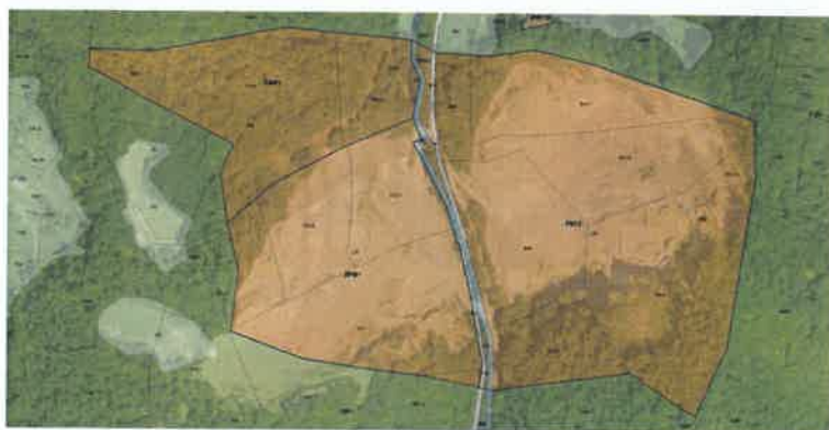
Slika 4: Predlog spremembe OPN za območje Zagaj

Zaradi narave predmetnih sprememb in dopolnitev (»vzpostavitve zakonitosti OPN na podlagi opozoril pristojnih organov v postopku nadzora nad zakonitostjo občinskih splošnih aktov v skladu s predpisi o državni upravi in lokalni samoupravi«), se SDOPN2 izvedejo po kratkem postopku sprememb in dopolnitev prostorskega akta.