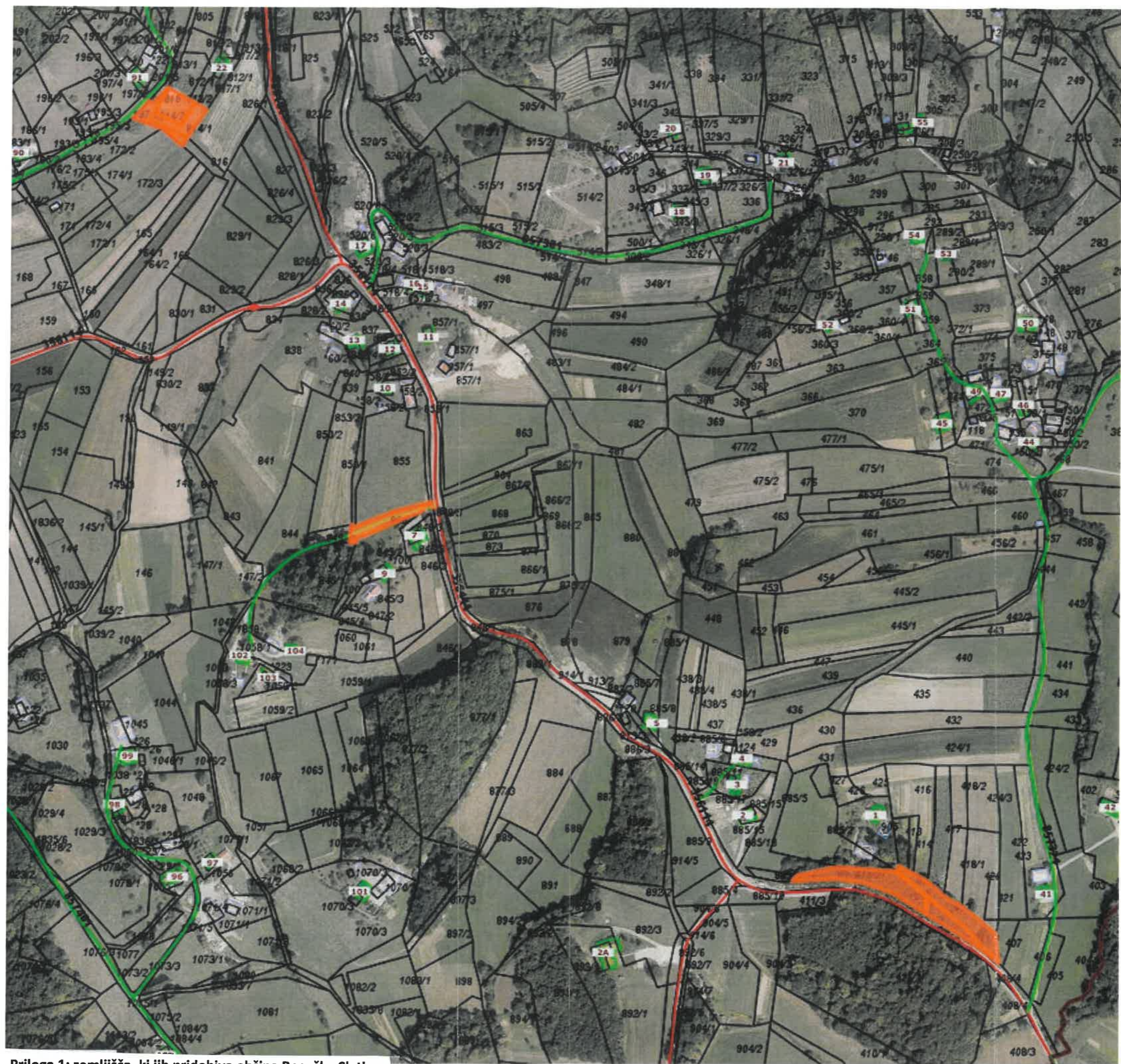
Priloga 1: zemljišča, ki jih pridobiva občina Rogaška Slatina