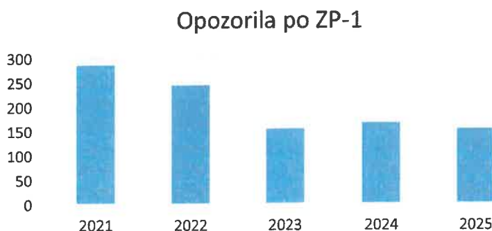
Tabela 3: gibanje števila opozoril po letih