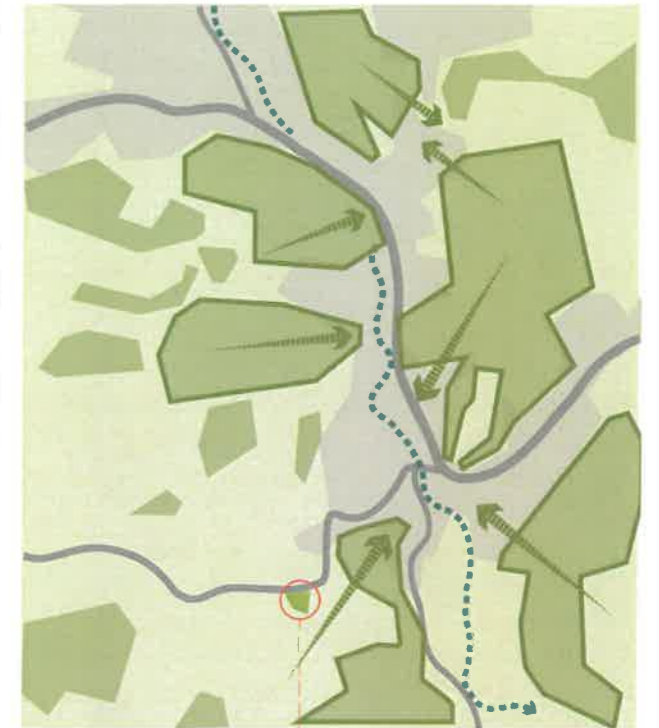
Slika: Shematski prikaz zelenih površin širšega območja naselja Rogaška Slatina

Območje obravnave po tipu zelenih površin sodi, predvsem v tip pokopališče, kjer je glavno vodilo da se oblikuje parkovno pokopališče kot celovita enota. Oblikovana je večja zelena površina, ki je del pokopališča. Zaradi podeželskega značaja kraja se umešča manjši del klasičnega pokopališča, preostali del pa se oblikuje kot parkovno pokopališče. Območje se ureja kot celota, kjer je vključenih veliko novih krajinskih elementov s katerim se vzpostavlja dodatna zelena površina v morfologiji razpršenih zelenih točk v širšem prostoru naselja.